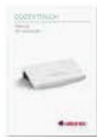
Libro de instrucciones